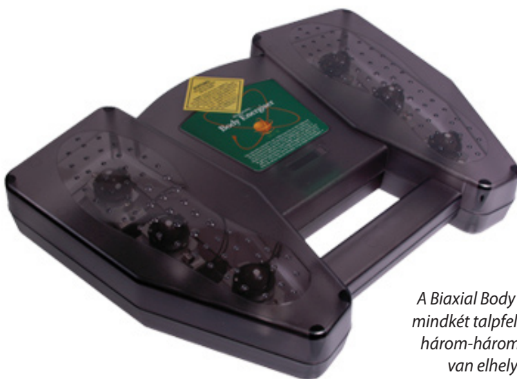
A Biaxial Body Energizer mindkét talpfelülete alatt három-három mágnes van elhelyezve, melyek a terápiás hullámokat biztosítják.

A résztvevőknek közvetlenül a készülék használatának megkezdése előtt objektíven értékelni fogják az idegfunkcióikat, majd ismét a 90 nap elteltével. Ezen kívül naplót is kell majd vezetniük, melyben egy 0 (nincs fájdalom) és 10 (legnagyobb fájdalom) közti skálán kell majd értékelniük az érzett fájdalmat. A kutatók ezen felül még 40 véletlenszerűen kiválasztott lábfejfekélyes biopsziáját is össze fogják hasonlítani a tanulmány előtt és után.